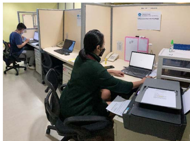
フィリピン大学マニラ校内の NCGM 連携オフィス