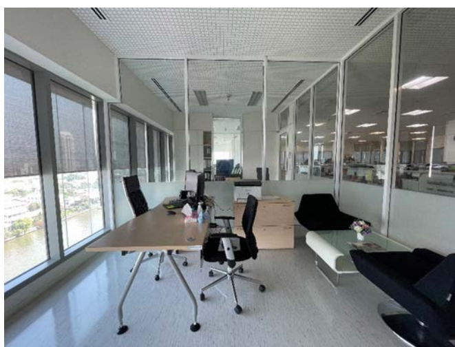
タイシリラート病院医学部内の NCGM 連携オフィス